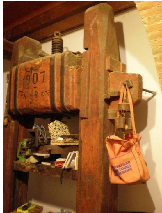
Die hundertjährige Olivenpresse steht noch am angestammten Platz