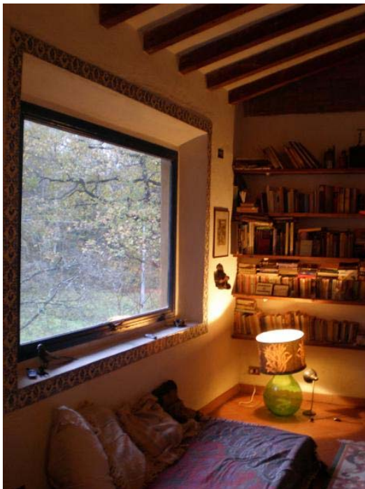
..und immer den Blick in die Natur