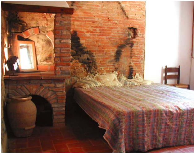
liebevoll erhaltene Details