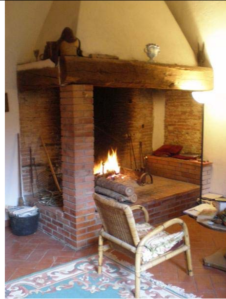
..im Kamin am Feuer sitzen